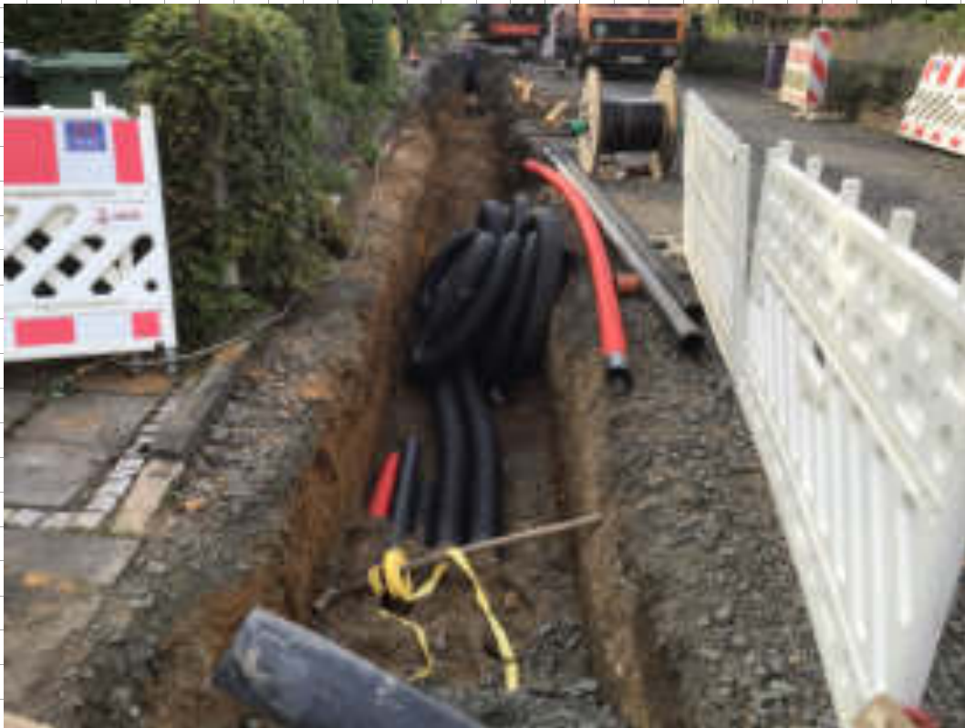
Die Richtigkeit des erhaltenen Aufmaßes bestätigt.